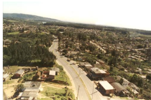
Vista superior Estrada João de Oliveira Remião