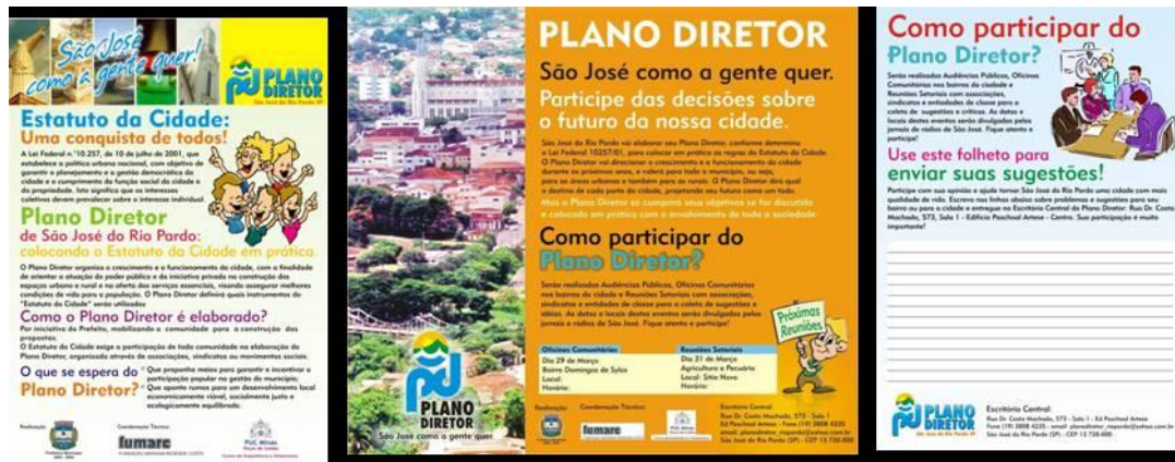
Fig. 1 material de divulgação

A primeira etapa consiste em se fazer a leitura comunitária, utilizando processos participativos e fazendo as comunicações para a divulgação dos resultados e convocação da população para as audiências, oficinas e eventos. Foram definidas atividades participativas para se fazer a leitura comunitária começando pela elaboração de uma cartilha, folhetos informativos, distribuídos juntamente com as contas de luz além de um folheto para se fazer as sugestões e depositar nas urnas que foram espalhadas pela cidade.