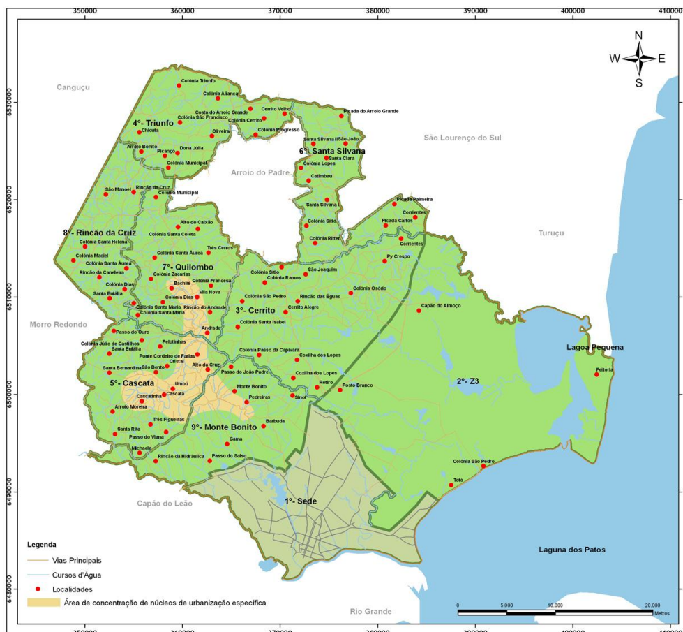
Figura 2: Mapa das localidades identificadas na zona rural do município de Pelotas, indicadas pelos pontos vermelhos. Em amarelo a Área de Urbanização Específica. Fonte: Imagem de satélite LANDSAT 543 em 12/11/2002 em http://glcf.umiacs.umd.edu . Base vetorial PMP/SMU 2006. Elaborado por Rafael Arnoni/Hectare em Agosto/2006.

Certamente essa discussão carece de maior discussão e aprofundamento, mas o que nos propomos aqui é evidenciar que a questão da proliferação dos assentamentos irregulares diz também respeito ao território rural, questão que deve ser considerada como se tem insistido, na observância dos novos usos e tendências de ocupação territorial.