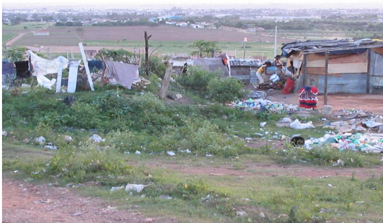
Fig.: Habitações precárias